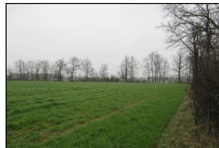
Plaine du Forez 2

Depuis, plusieurs réunions téléphoniques et/ou physiques ont eu lieu entre l'ISARA et les partenaires des territoires afin de préciser les différents points. A ce jour, les avancées sont les suivantes :