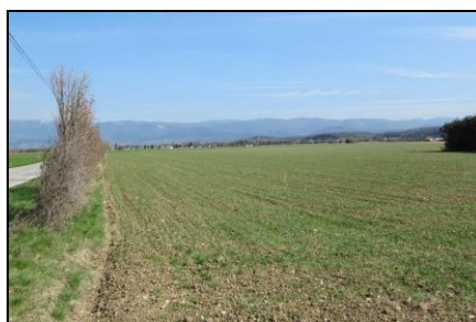
Plaine de Valence 2