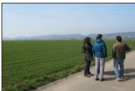
Plaine de Bièvre 2