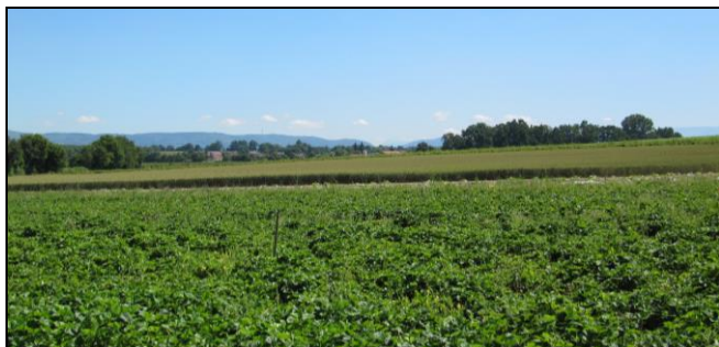
Chez un producteur de céréale et petits fruits en plaine de Bièvre 2