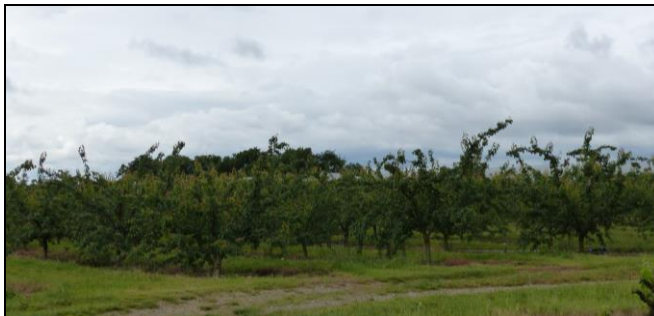
Chez un arboriculteur et viticulteur en plaine de Valence 3

Participation des chercheurs de l'ISARA aux groupes institutionnels locaux : il a été acté dans chaque territoire que les chercheurs de l'ISARA seraient invités aux groupes institutionnels locaux, à savoir les instances (comités techniques et comités de pilotage) des CVB, ainsi que des PAEC le cas échéant (cas de la plaine du Forez et de la plaine de Bièvre). Sur la plaine de Valence, où il n'y a pas de PAEC, il est prévu de créer, au sein du CVB, un groupe de travail spécifique aux problématiques agricoles auquel l'ISARA sera convié. La participation de l'ISARA à ces groupes a pour objectif d'assurer que notre projet fonctionne en complémentarité avec les autres actions des territoires, et nous aidera également à mieux connaître ces derniers.